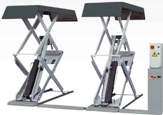
SFL 5518 - kg 3.000 SF55081 - kg 3.000 SFL 5535 - kg 3.500 RENAULT 1011300 RENAULT 1011200 ENCASTRÉ - INGROUND