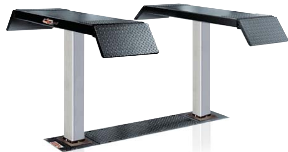
SDI 120 - kg 3.500 RENAULT 1012600