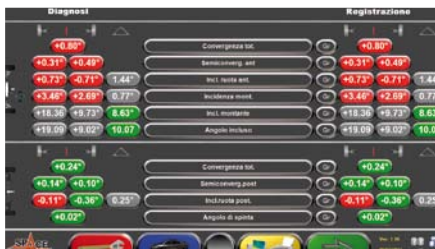
ACTIVE PLUS Bluetooth ARN 84 WS RENAULT 1013500